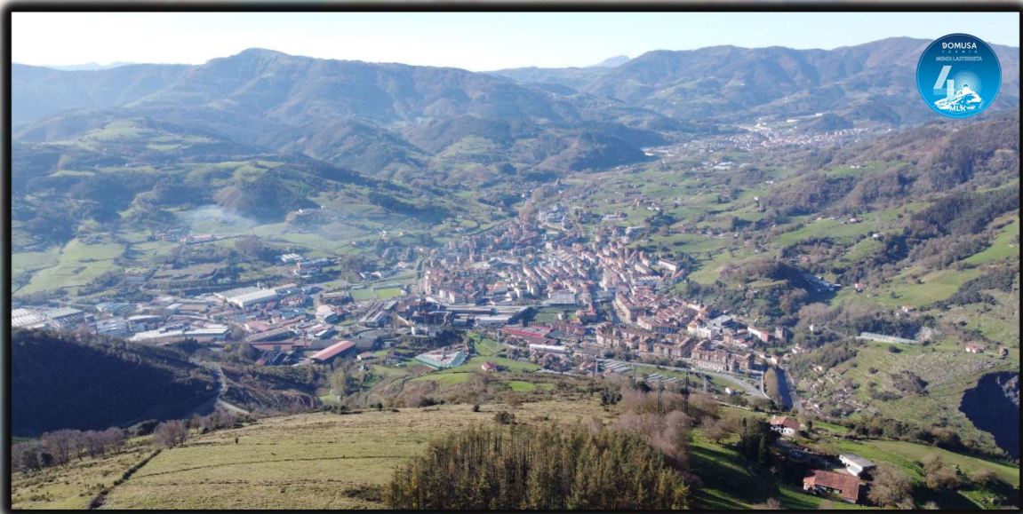
Azpeitia desde Arroita (Arauntza)

Mirando a la derecha, tendremos a la vista la primera cima, Arroita 612m (más conocida como Arauntza). Aquí tendremos las primeras pendientes del día, llegaremos a la cima pasando por el lado del caserío Arauntza, y si miramos hacia atrás, tendremos una hermosa vista del pueblo de Azpeitia.