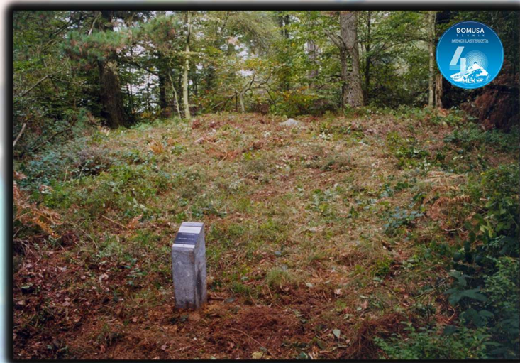
Dólmenes en dirección Mandubia

Tras hacer cumbre y pasar junto al caserío Larrarte, siguiendo siempre las marcas GR, llegamos a la ermita de San Gregorio y desde allí a Mandubia, donde se ubicará el cuarto avituallamiento del día. Cabe destacar, desde la zona de Santa Águeda, el número de túmulos y dólmenes en dirección a Mandubia.