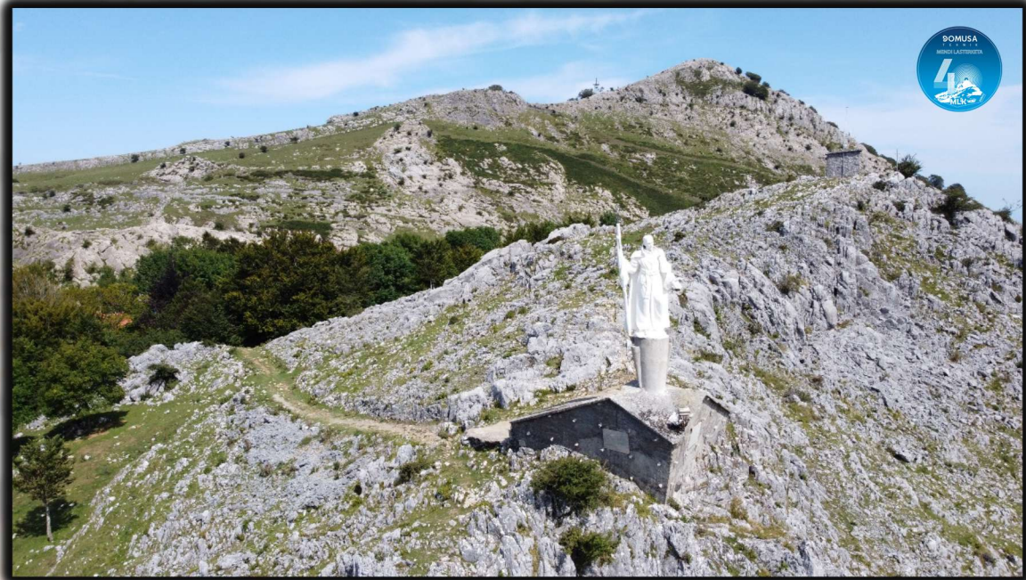
Estatua de San Ignacio en Xoxote

Tras dejar atrás el refugio, a través del pozo de Izarraitz llegaremos al Nevero. Seguimos descendiendo junto a la fuente de Azketa y nos dirigiremos hacia el pueblo para completar los últimos kilómetros. Los últimos 6 kilómetros son cuesta abajo, a excepción de una pendiente a 2,5 kilómetros de meta. Al llegar a la ermita de Magdalena, tomaremos a la derecha y recorreremos las calles del pueblo, con destino a la plaza mayor, donde estará situada la meta.