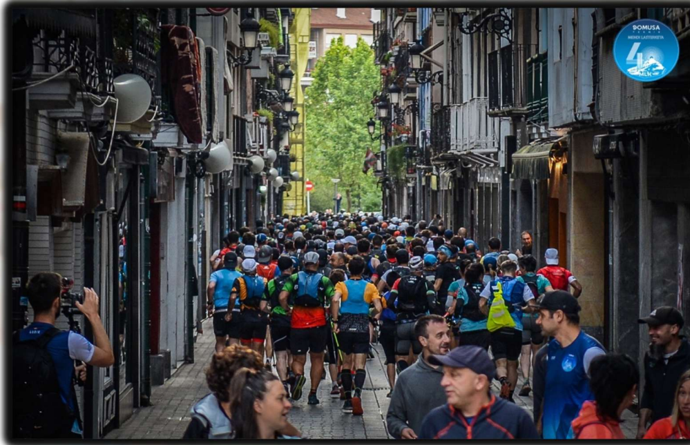
Erdi Kale de Azpeitia

La salida de la carrera será en la Plaza Mayor de Azpeitia y los primeros metros, recorreremos por Erdi kale, centro de todas las fiestas de Azpeitia.