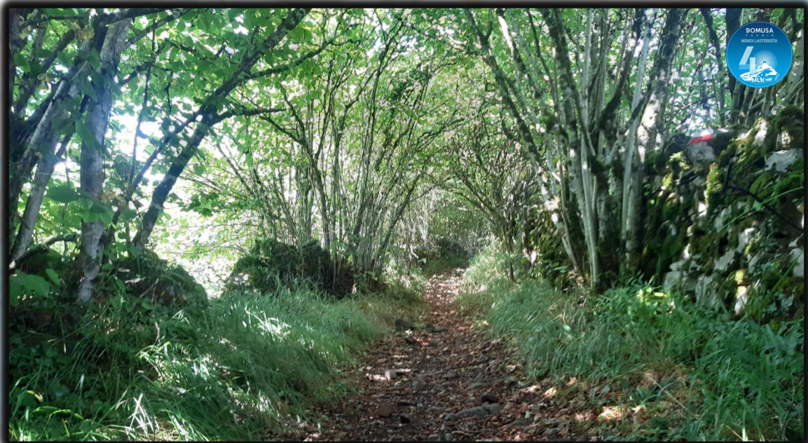
Marcas GR dirección Santa Águeda

Tras comer y beber, seguiremos las marcas GR y a la altura del caserío Otsagabia, llegaremos a la carretera de Urraki que une Azpeitia con Tolosa. Cruzamos la carretera y siguiendo de nuevo las marcas GR llegaremos a Santa Águeda.