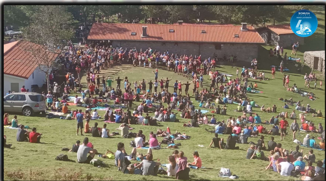
Romería en Zelatun

Una vez pasada Gazume, enseguida veremos las bordas de Zelatun, lugar preferido para todos los montañeros de la zona del monte Hernio y de toda Gipuzkoa. Cómo olvidar las romerías que suelen celebrarse todos los domingos de septiembre.