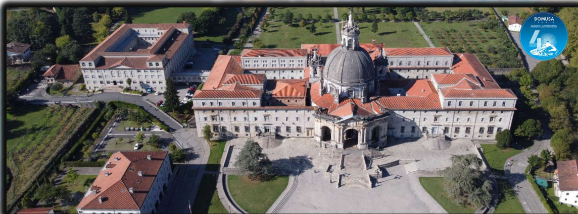
Basílica de Loiola

Tras dejar el yacimiento a un lado, la siguiente zona importante será la basílica de Loyola, a la que llegaremos por la parte trasera, por el albergue y por las praderas de los Jesuitas de Loyola (sólo los corredores tendrán permiso de paso), para salir delante de la Basílica.